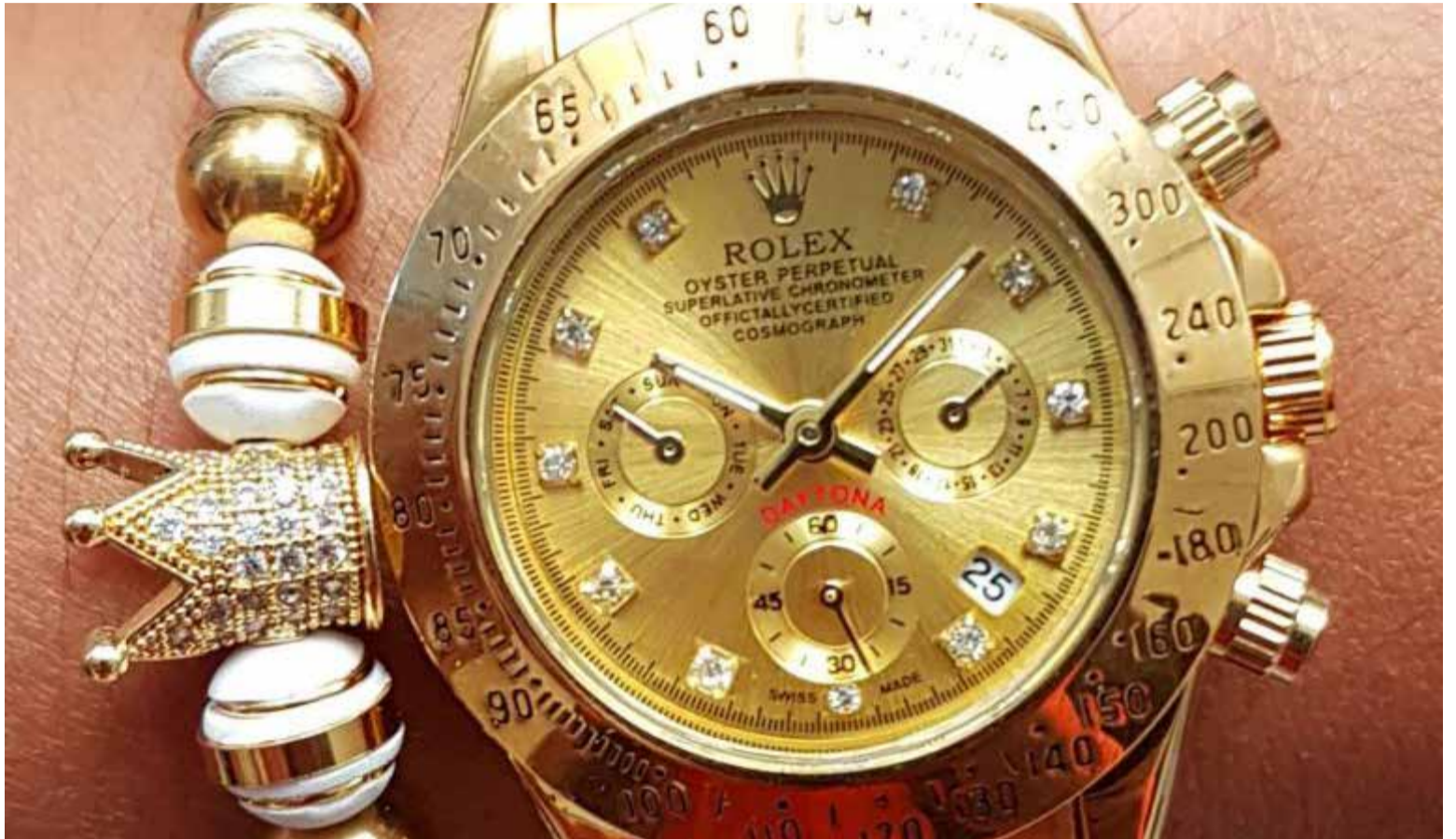
El rolex de la presidenta del Perú

Pero fue y de qué manera. Ante las cámaras de televisión unos agentes del ministerio público, o de una gendarmería paralela, vaya uno a saber las diferencias, tumbaron a golpes de mazo la puerta principal de la residencia particular de la presidente del Perú para dizque realizar un allanamiento y tratar de encontrar un par de relojes marca Rolex, que la presidente ha exhibido en su pulsera en más de una oportunidad cuando pronuncia discursos fren-