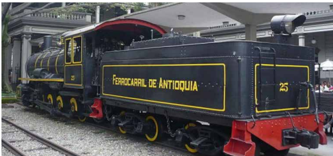
La primera maquina que transitó en Antioquia.

En los documentos entregados a los tribunales de arbitramento se evidenció la corrupción que rodeó el «tumbado», causante de los problemas. Papeles incautados a la «belleza» de Santiago Pérez Triana en allanamiento efectuado a la residencia de la egregia figura de su padre el ilustre presidente liberal, Santiago Pérez Manosalva, demostraban que aquel había acordado jugosas comisiones por los ferrocarriles de Antioquia y Santander que ascendían al 3% del total e igualmente por la aprobación y el aumento del auxilio nacional al tren paisa y por gestiones paralelas que salpicaron de contera a figuras del gobierno central, verbigracia, Clímaco Calderón y José Manuel Goenaga, ministro de Fomento, quien negoció y aprobó