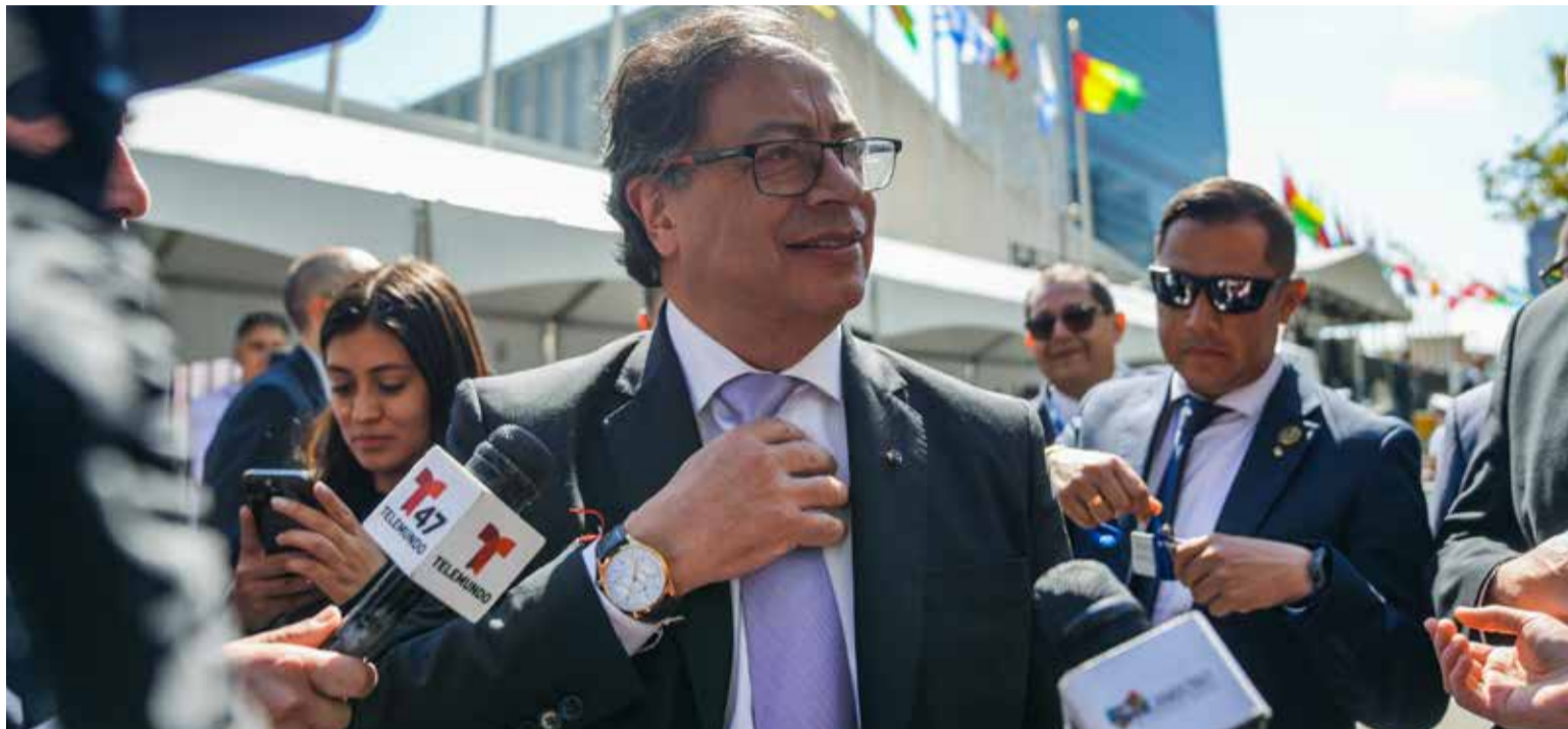
El debate público en la calle es una expresión legítima de la opinión ciudadana, contribuye a visibilizar las preocupaciones y posturas de los diferentes sectores de la sociedad.