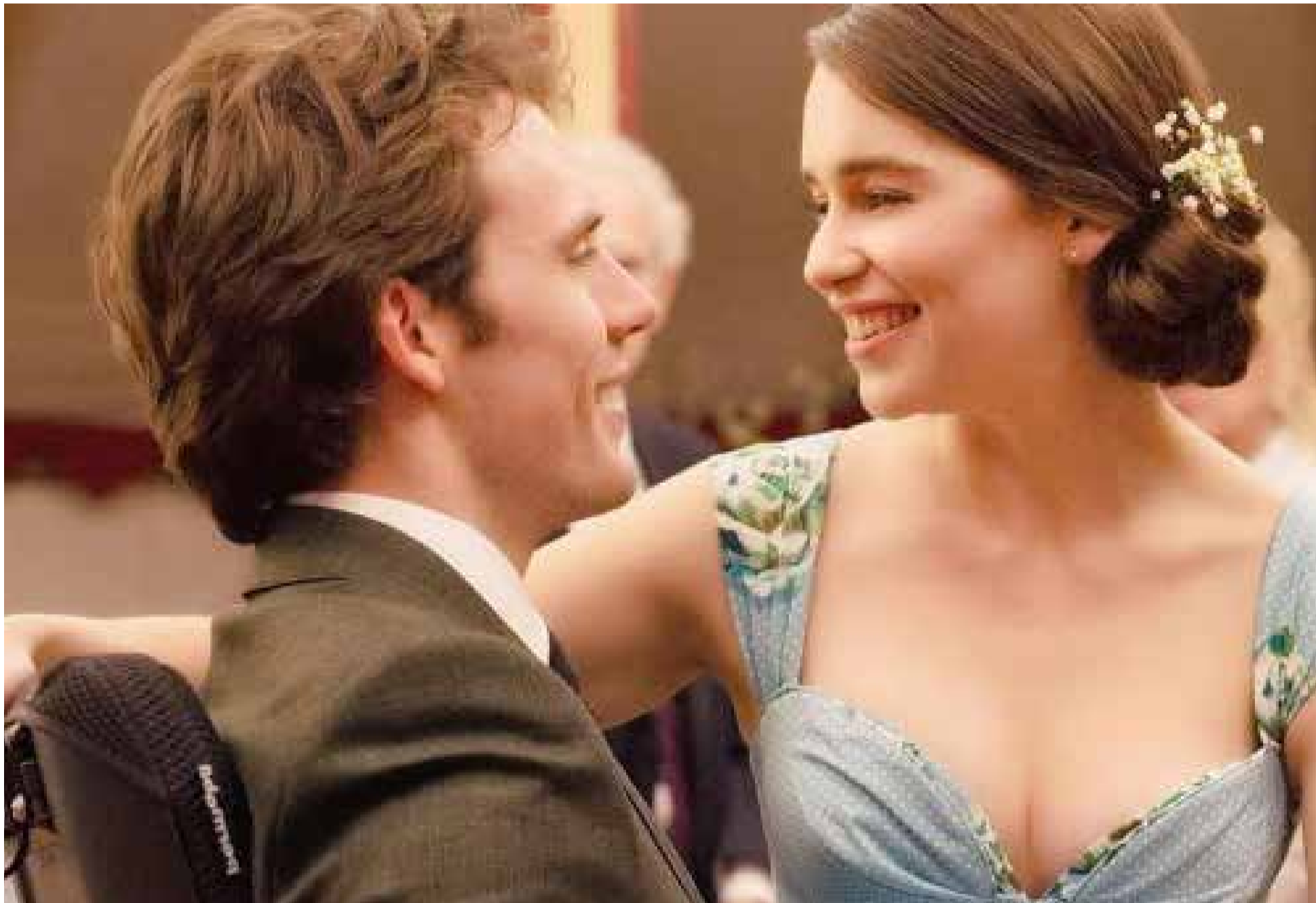
Película «Yo Antes de ti»