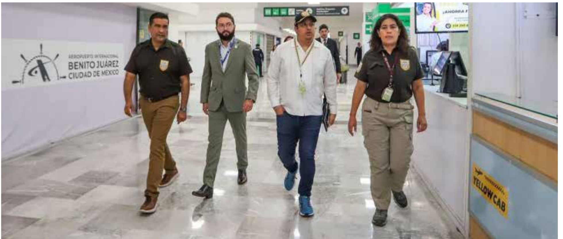
Embajador y cónsul en México visitaron aeropuerto de Ciudad de México para verificar situación de colombianos inadmitidos.