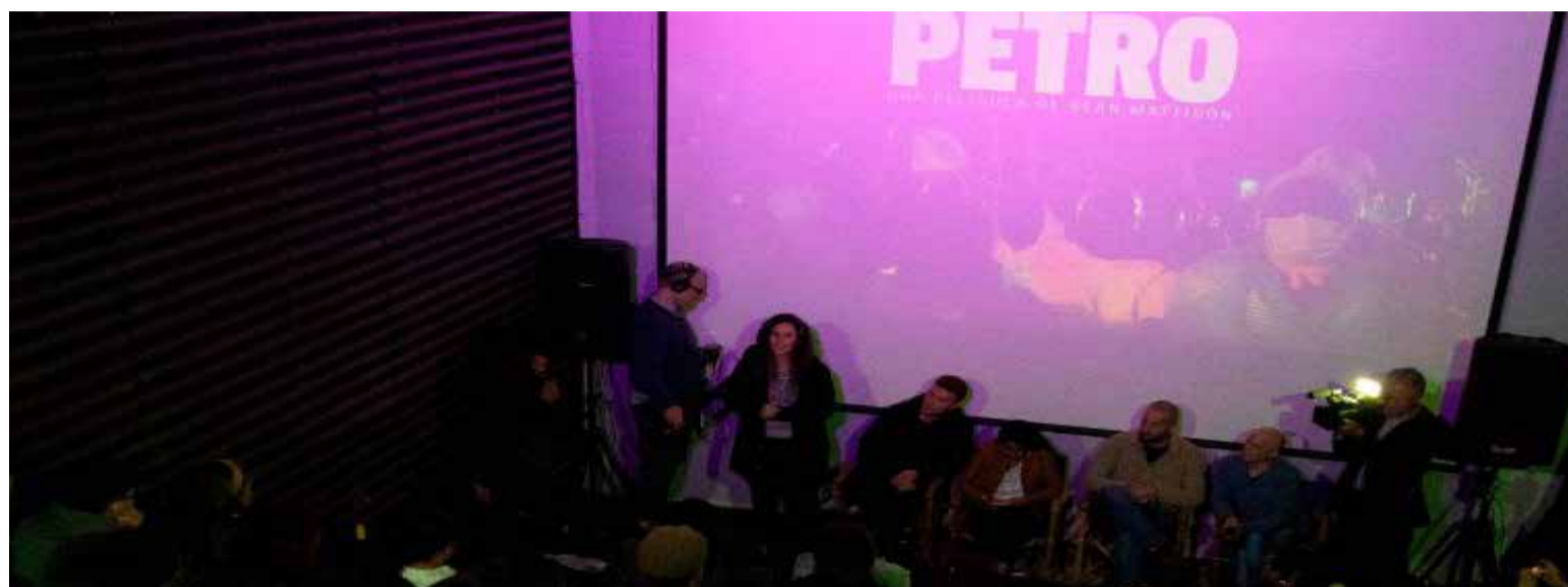
Así se vivió el estreno nacional del documental 'Petro' en Ciudad Bolívar