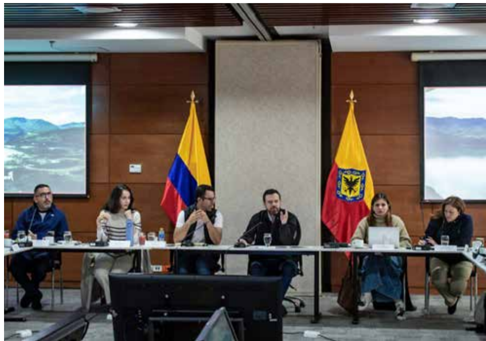
El alcalde de Bogotá, Carlos Fernando Galán empezó a recibir críticas de la ciudadanía por la lentitud en atender los problemas de los bogotanos.