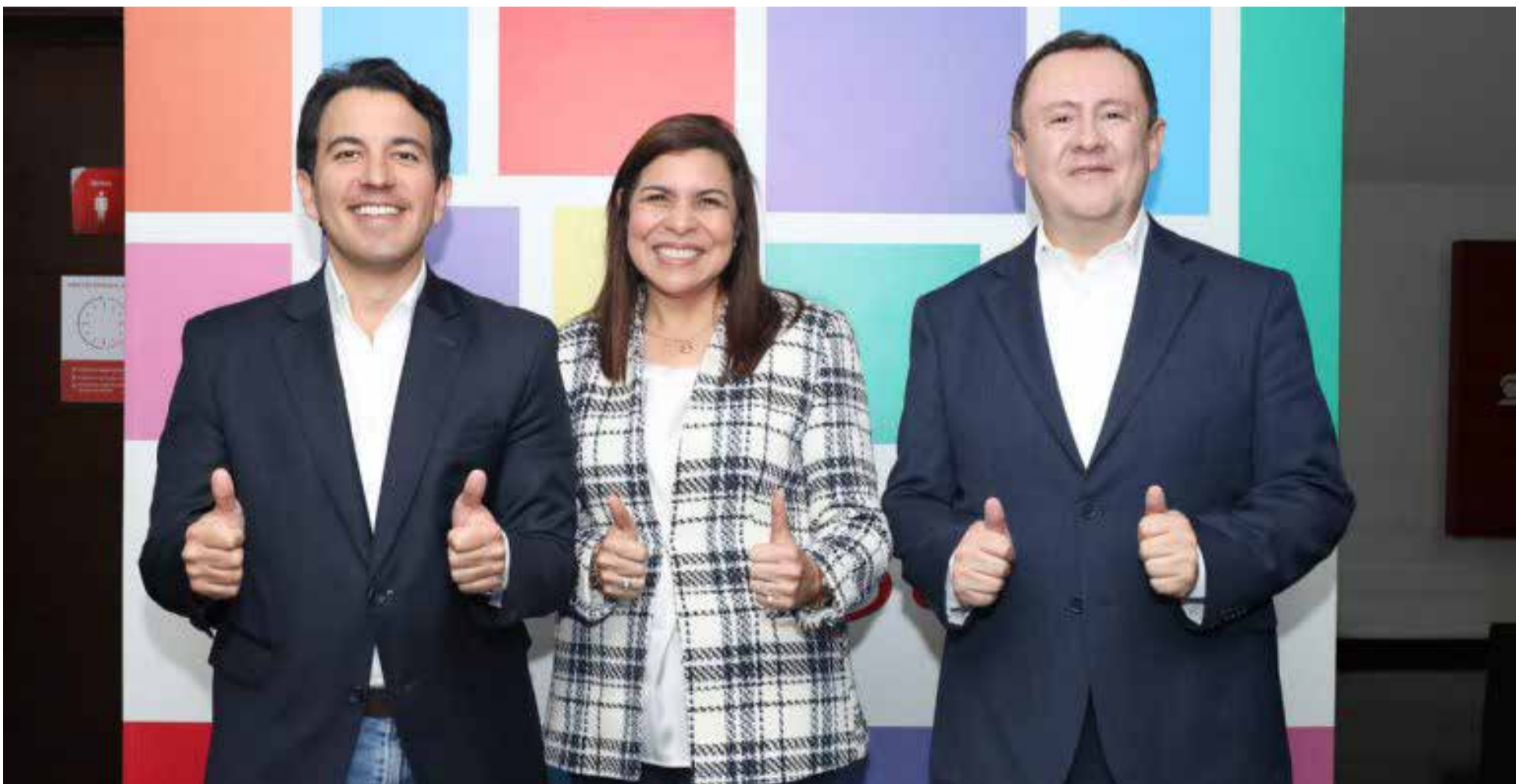
Esta noticia importante para el banco, los clientes y los directivos que celebran.

Cabe destacar que, en 2021, Scotiabank Colpatria fue la primera entidad financiera de Colombia en obtener la certificación Friendly Biz, gracias a su liderazgo en materia de inclusión y diversidad.