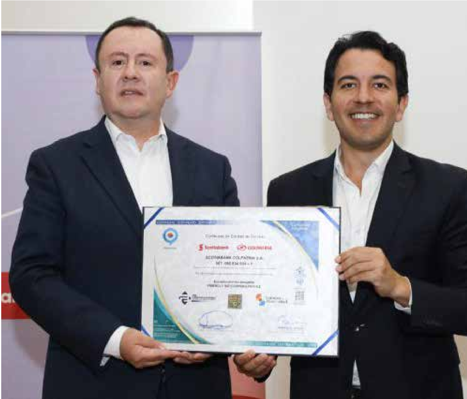
Scotiabank Colpatria fue la primera entidad financiera de Colombia en obtener la certificación Friendly Biz, gracias a su liderazgo en materia de inclusión y diversidad.