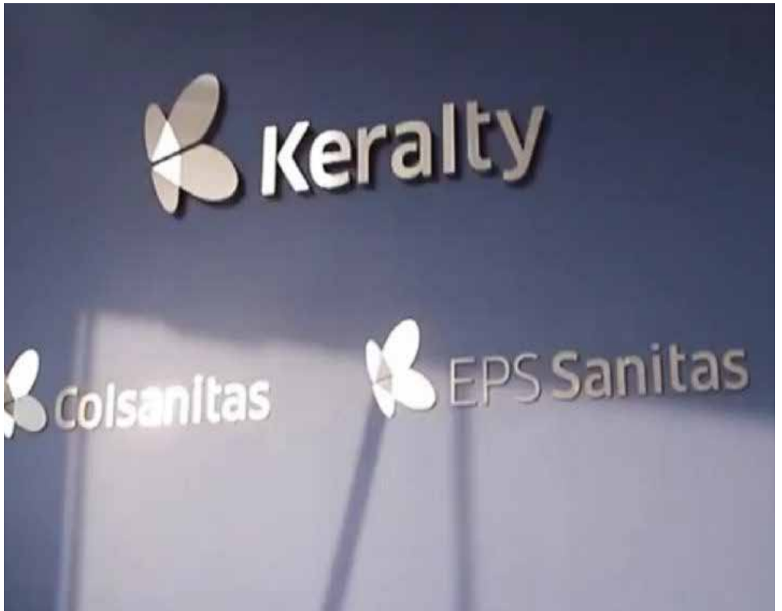
Mágicamente esfumaron muchos billones de pesos destinados a la salud de los colombianos, denuncian los sindicatos de la EPS

Pero lo cierto, es que las evidencias demuestran lo contrario. De las siete agrupaciones políticas a las que pertenecen los