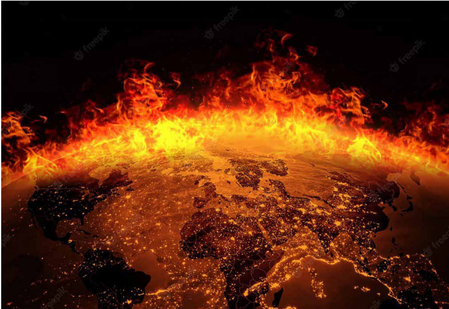
Así arderá la tierra para luego evaporarse.